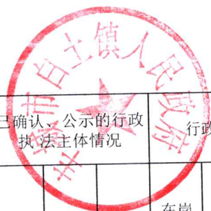
__白土镇__（政府、系统、部门） __2022__年度行政执法总体情况统计表